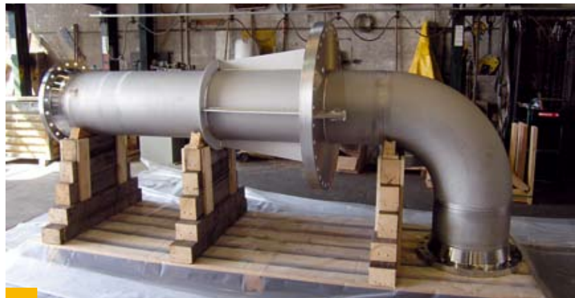
Einbaufertige Spools – Vorfertigung im Werk sichert Qualität

Die Vorfertigung bietet im Gegensatz zur „vor Ort“-Komplettierung Vorteile hinsichtlich Qualität und Zeit. So erfolgen das Verschweißen der Einzelkomponenten