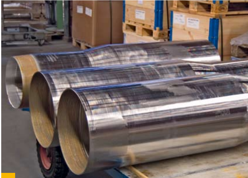
Ausgangsprodukt für unsere Komponenten ist das qualitativ hochwertige Rohr aus eigener Produktion: Cross Over Subs 13 3/8" / 16" in Alloy 625