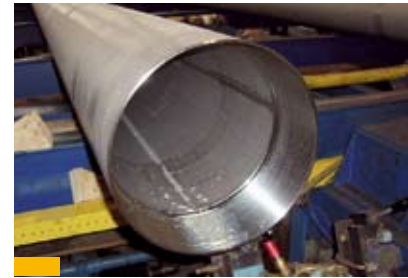
Casings gefertigt nach Kundenspezifikationen

In diversen Einsatzgebieten der Geothermie bedingen die zu fördernden Medien hochkorrosionsbeständige Werkstoffe. Hierfür bietet BUTTING vielfältige Lösungen im gesamten Anlagenaufbau: Von Casings und den dazugehörigen Komponenten wie dem gesamten „Float Equipment“, „Line Hangers“ und „Tie Back Einzelteile“ für die Tiefbohrungen